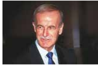
Syriens præsident Hafez Assad (senior) skabte et sekulært Syrien i rivende udvikling. En torn i øjet på de religiøse nabostater.

Med udgangspunkt i denne ekstreme hjælpeløshed begyndte modstanden