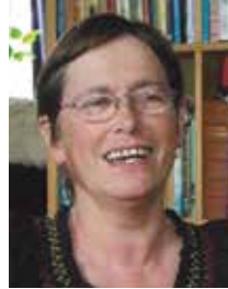
Af Lilli Rodeck

Statsministerens tale om "ordentlighed" er hykleri af værste skuffe