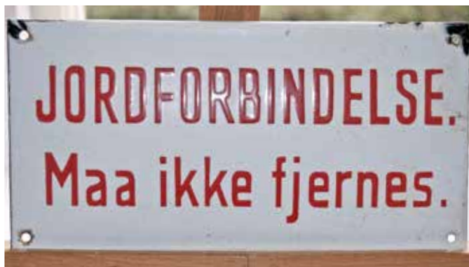
Vreden over de uværdige gak-kurser for aktiverede blev brugt af politikerne til at fjerne kommunernes tilskud til kurser for ledige overhovedet

– Det er usmart at skære ned på de former for aktivering, som vi har evidens for, virker. Man risikerer en situation, hvor nogle personer, som kunne have fordel af aktiveringstilbud, ikke får muligheden, udtaler han til Altinget.