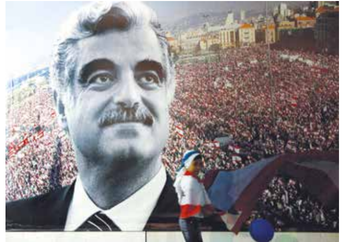
Bilbombe mordet på Libanons tidligere statsminister Rafiq Hariri i 2005 skulle dæmonisere Syrien, der hjalp Libanon mod Israel.

I 1991 havde Rusland sine indre vanskeligheder. På det tidspunkt traf præsident Assad en klog og ikke mindst pragmatisk beslutning.