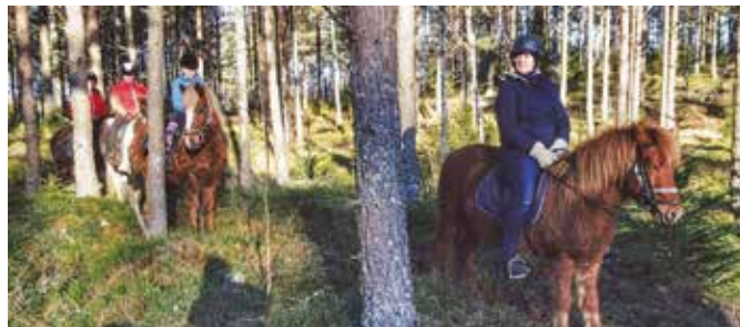
En tur på Islandsk hesteryg gennem skoven