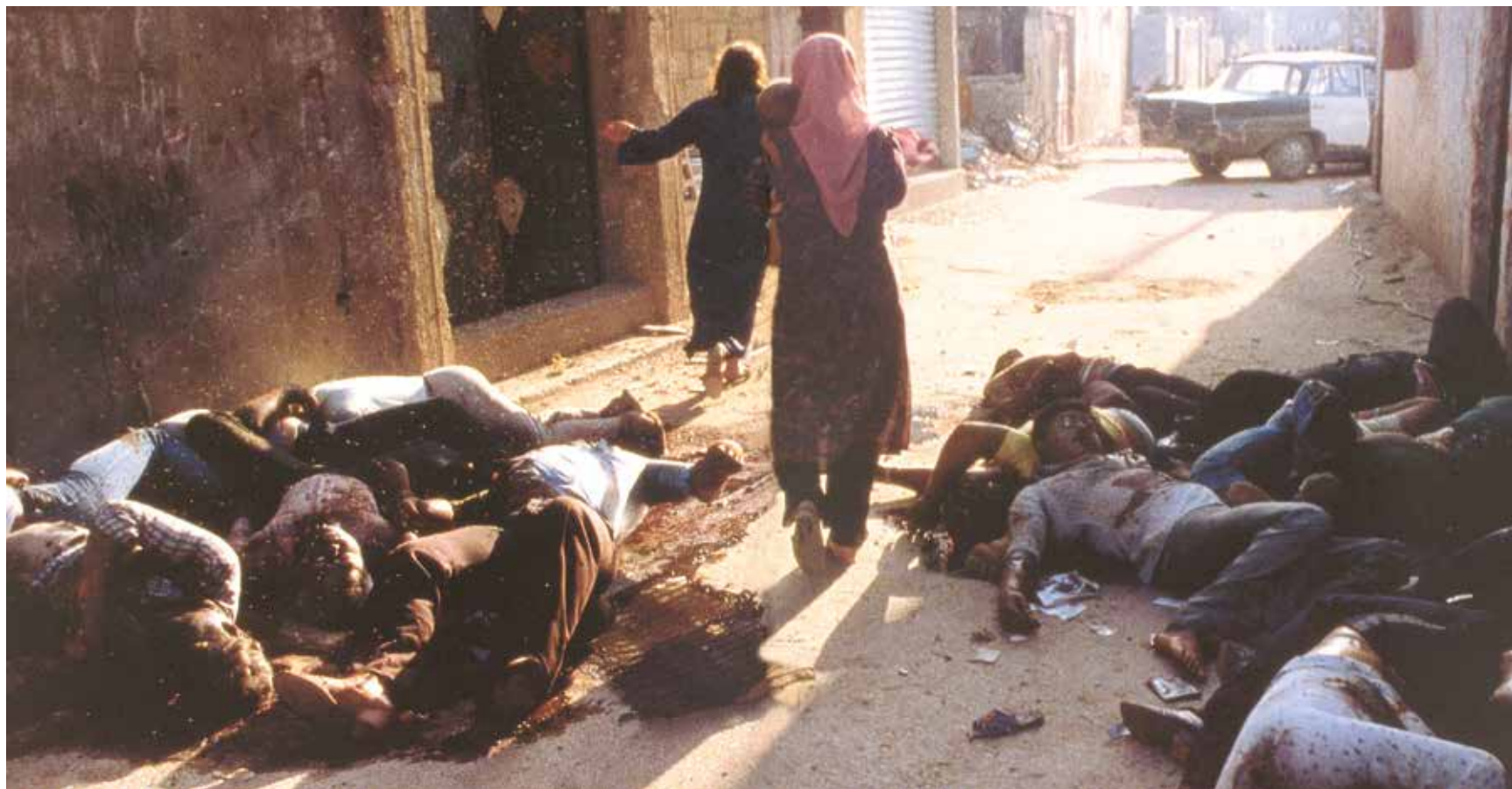
Israels massakre på 2000 palæstinensere i flygtningelejrene Sabra og Chatila under invasionen af Libanon i 1982 fik modstanden mod Israel til at samle sig.

ikke mindst udgjorde Syriens fremskridt på områder som industri, teknologi og landbrug en langsigtet risiko for Israel. Den Anti-syriske alliance, ledet af USA og Israel, blev urokkelig og beslutsom på at stoppe Syriens fremgang og sende landet tilbage til mørkere tider.