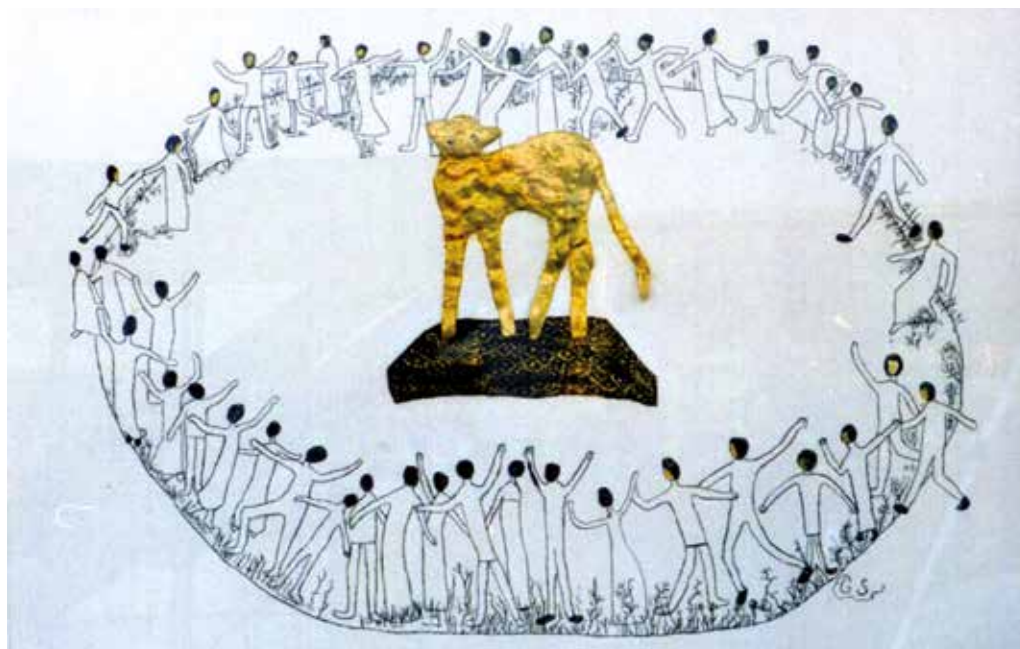
Dansen om guldkalven er så samfundsskadelig at danserne må stoppes

Det var nok også en god ide at den aggressive direktør fandt ud af at arbejdsløse på kontanthjælp skal sælge deres bil, hvis de har haft en sådan inden de måtte ty til kontanthjælpen. Helt efter bogen om at mer' vil have mer', mener direktøren at virksomhedspraktik med løntilskud skal i fokus.