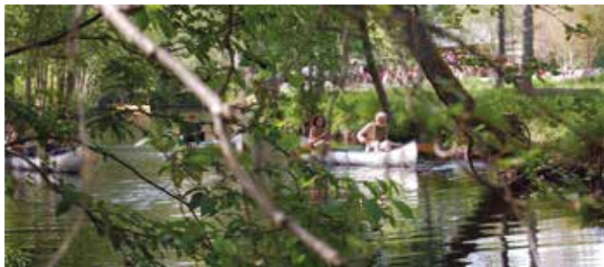
Kano og kajakroning på Tidan

Sommerlejren finder sted i uge 28, altså fra lørdag den 9.