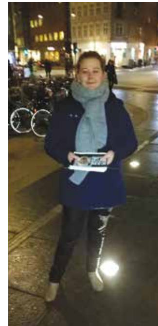
En af de aktive unge fra 3F Ungdom i gang med at uddele løbesedler på Nørreport i København

I forskellige byer gik de unge faglige på gaden med løbesedler mod forslaget om indslusningsløn, der i denne omgang skulle ramme flygtninge der kommer i arbejde, uanset deres uddannelse. 3F ungdom siger i løbesedlen: Vi har allerede indslusningsløn i Danmark. Den hedder lærlingeløn og er på omkring 70 kr. i timen. Når de er udlært kommer de på lige vilkår med deres danske kolleger. Det er vellykket integration. Hvis de indfører ny indslusningsløn vil det skabe en ny underklasse, der aldrig vil komme til at tjene mere. Det vil presse de