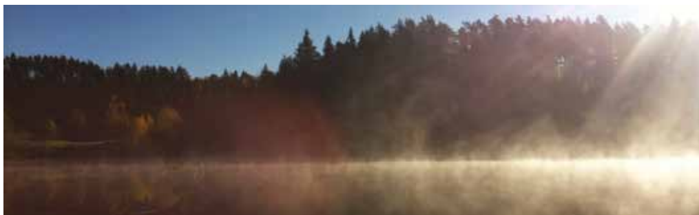
Sommerlejr i Sveriges smukke natur