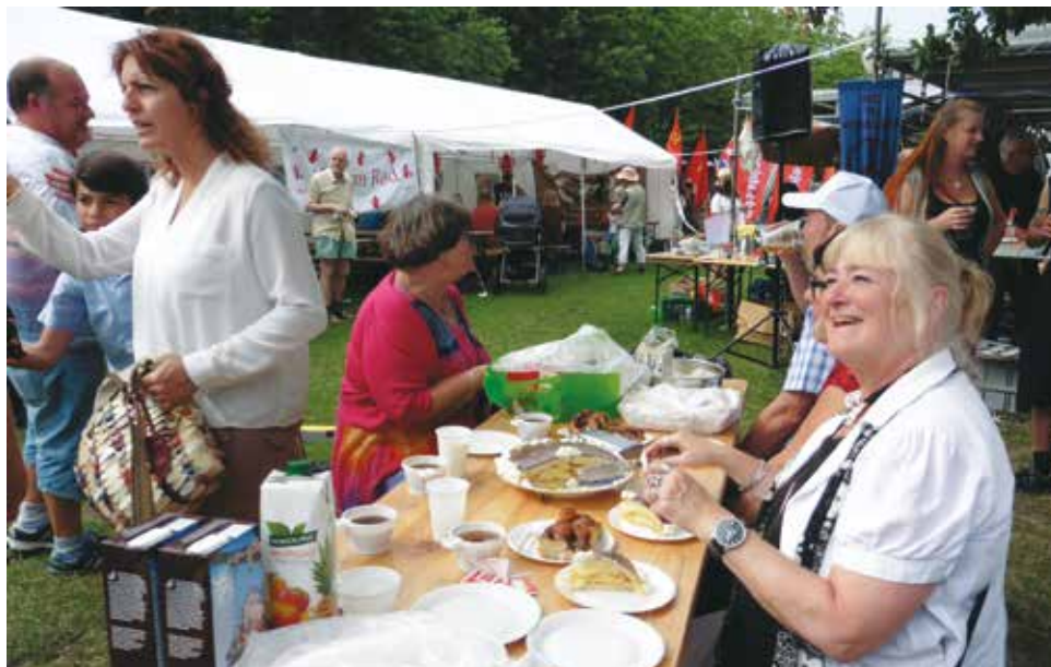
Kaffe, kager og højt humør