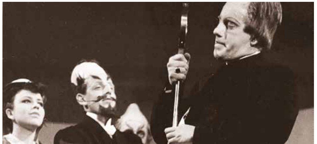
Rundhoder og Spidshoder, Riddersalen 1936.