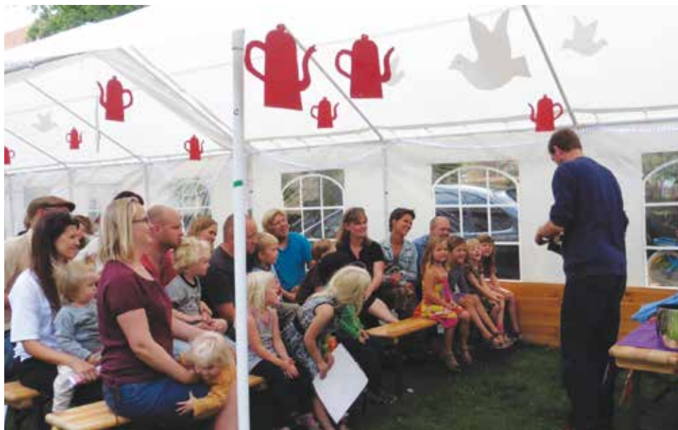
Trylleri for børn og barnlige sjæle