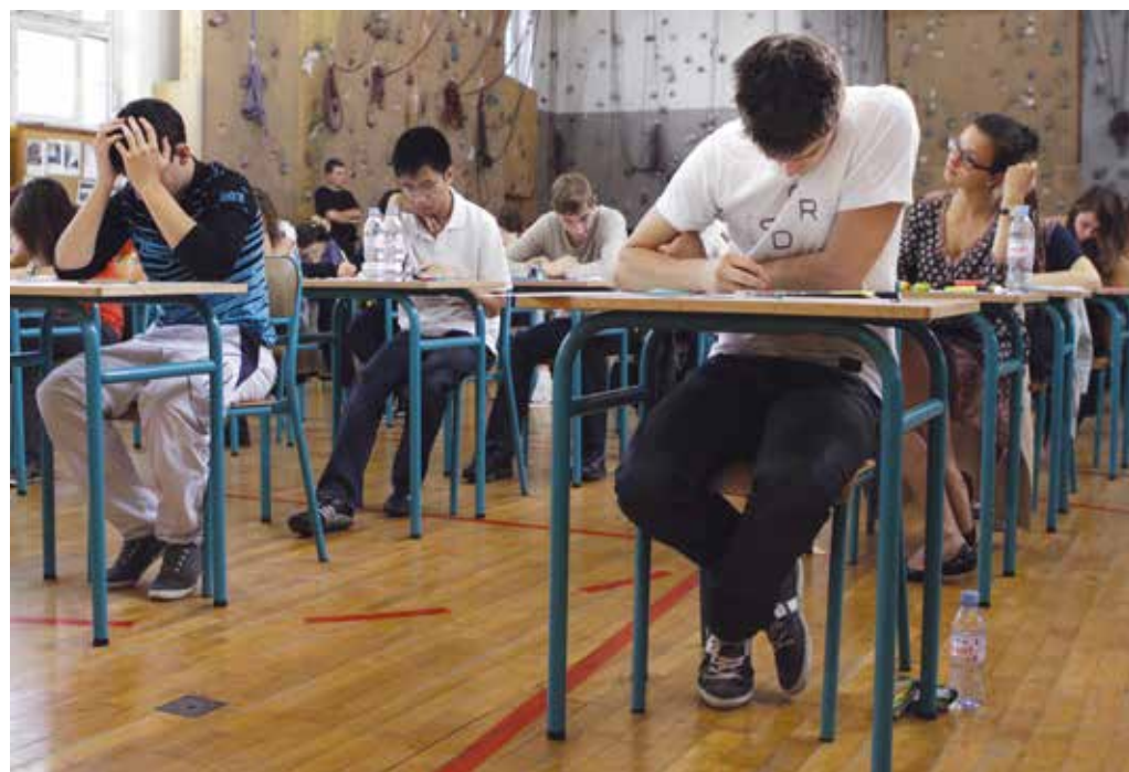
En stor del af eleverne klarede ikke optagelsesprøven, fordi Undervisningsministeriet besluttede, at prøverne skulle være sværere at bestå, end der først var lagt op til.

Mange censorer har dumpet elever efter, at rettevejledningen blev strammet, mener uddannelsesforbundet, som mener at det er uheldigt, at bedømmelsen blev ændret.