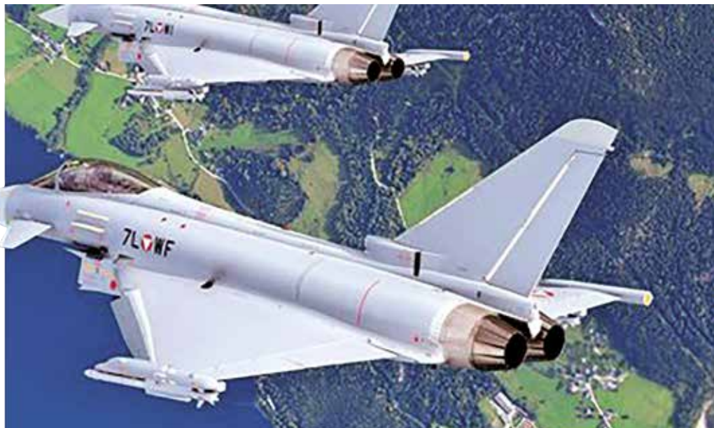
Både Airbus og Lockheed Martin deltog på Folkemødet på Bornholm for at promovere deres kampfly.

Når økonomien har været så fremherskende et dilemma i forhold til problemer om liv