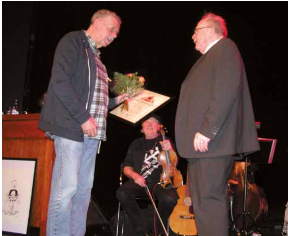
Jan Myrdal (th.) overrækker Leninprisen til Mikael Wiehe.