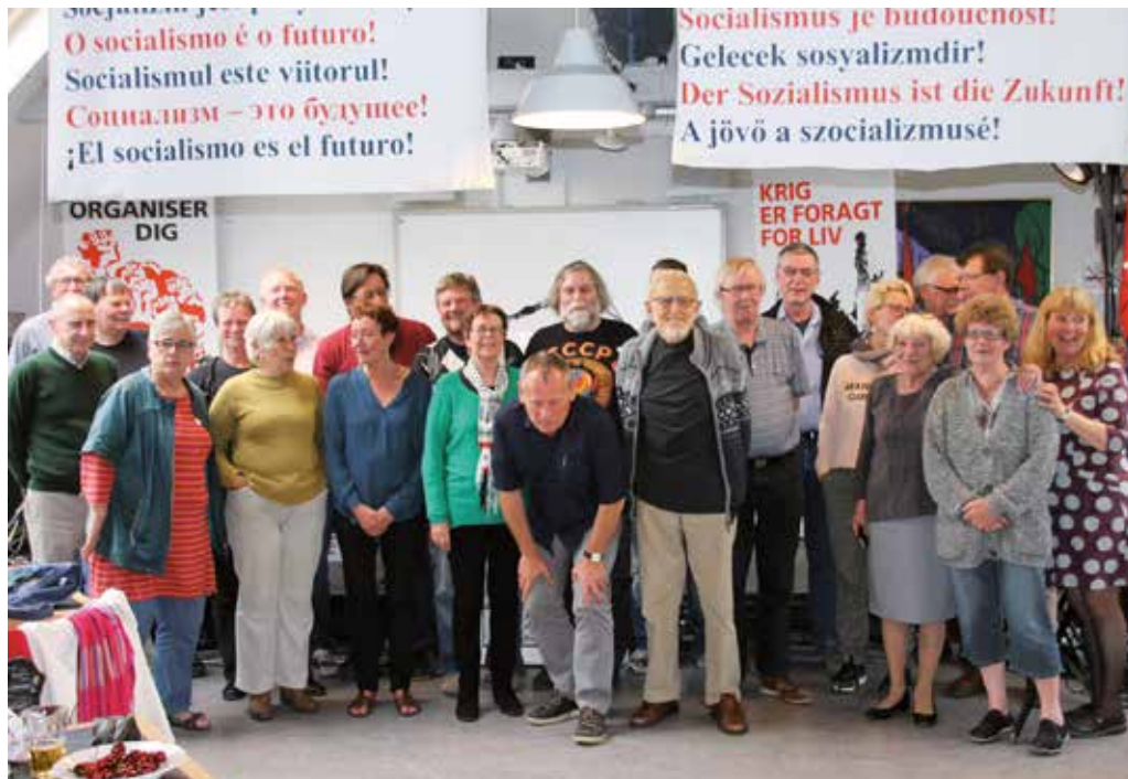
Den nyvalgte landsledelse

på skoler, sociale institutioner og hospitaler, med alvorlig sundhedsfare til følge. Ældreområderne med hjemmepleje og madordninger, plejehjem som udliciteres. Hertil skal føjes EU's servicedirektiv, der betyder at udenlandske firmaer har ret til at byde på og overtage opgaver, som kommunerne har pligt til at udbyde, overalt i Danmark.