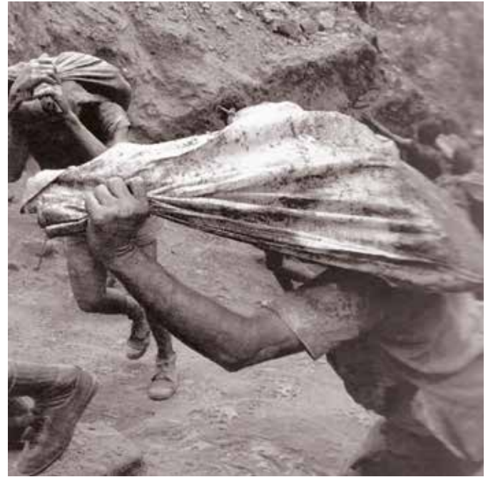
Fotografierne fra minen er fra bogen "Arbejdere"

I dag er "Instituto Terra" overdraget til staten og er et naturreservat. Dette arbejde gav ham fornyet inspiration til