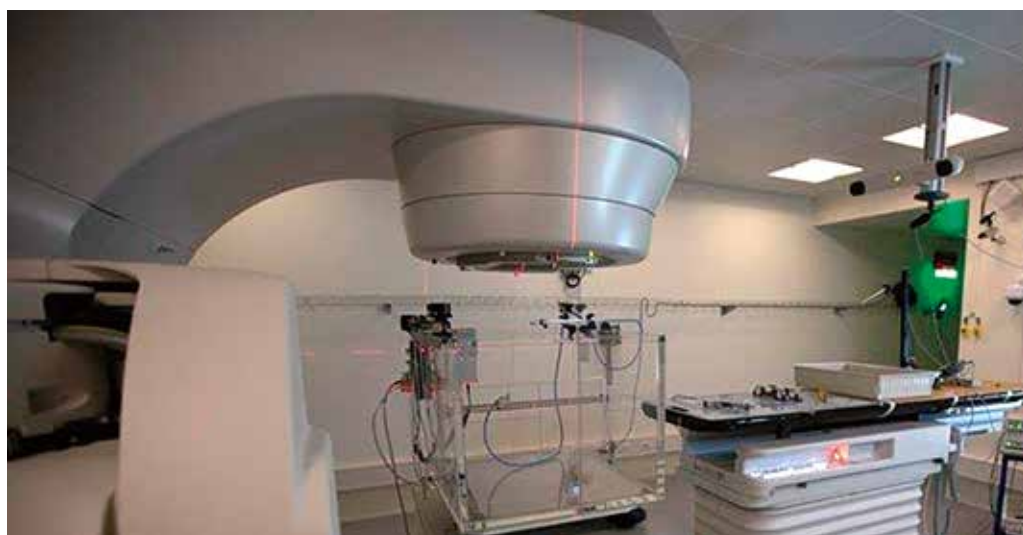
Kampfly eller strålekanoner?

Vi ses til K- festival i Nørrebro- parken 15.-16. august