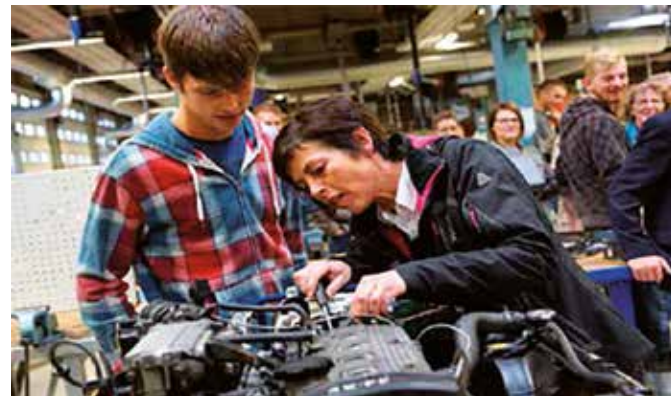
Undervisning på fagskole

Hvad bliver der af alle de humanistiske fag, hvis man følger Henrik Sass Larsens forslag? Ydermere indebærer hans forslag ikke, at indu-