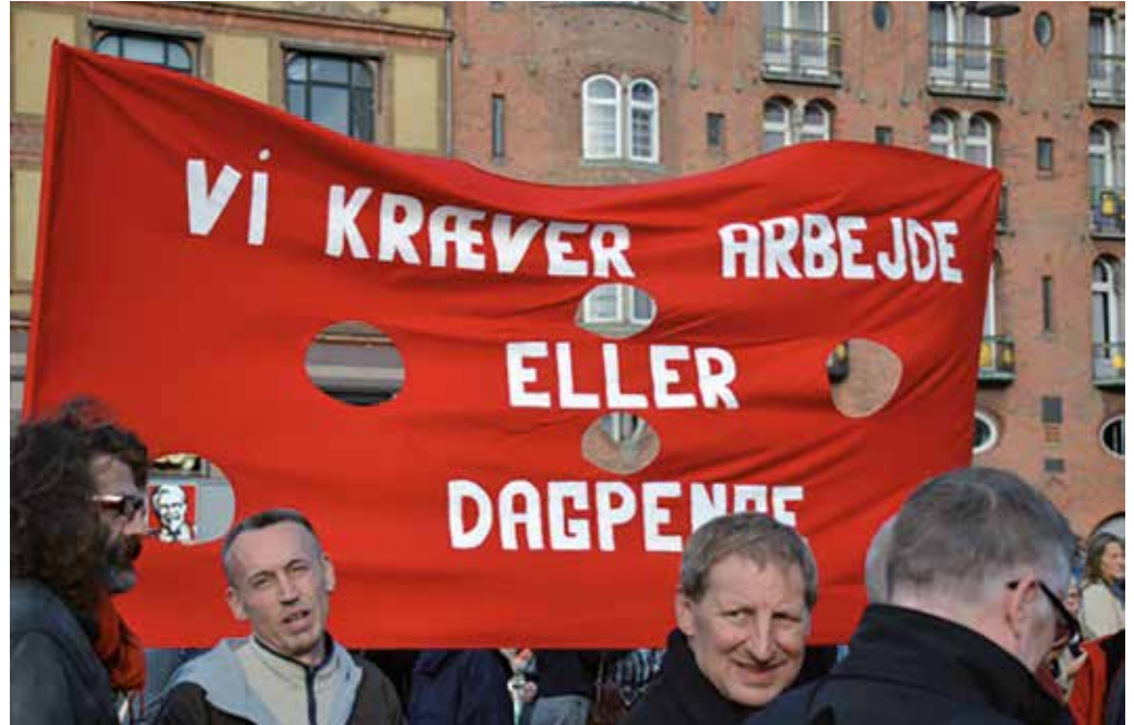
Vi kræver arbejde eller dagpenge

Efter at det gik op for Folketinget, at man havde skidt i nældeerne, har man forsøgt