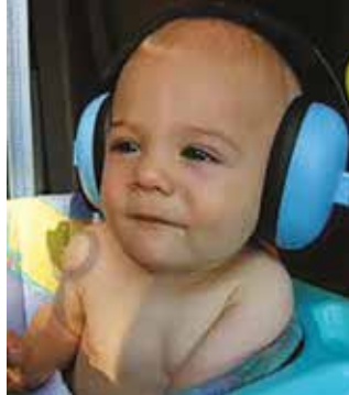
Skal det være fremtiden for vores børn i daginstitutionerne?

SF har foreslået en børnemiljølov, der ligesom de voksnes arbejdsmiljølov sikrer børnene i daginstitutionerne ordentlige 'arbejdsforhold'. Derfor vil partiet afsætte 200-300 millioner kroner til dels at få undersøgt grænseværdierne for børn i