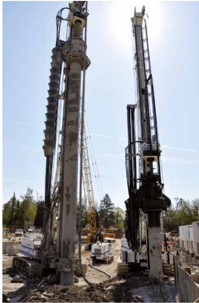
Beskæftigelsesminister Henrik Dam Kristensen (S) vil ikke forpligte kommuner og regioner til at bruge arbejdsklausuler, der kan sikre danske løn- og arbejdsvilkår på eksempelvis Metro-byggeriet.

Da Danmark siden er blevet medlem af EU, er behovet for at lovgive vokset så kommuner og regioner skal kunne sætte effektivt ind mod social dumping. Men i dag ligger der kun en opfordring - altså en ren hensigtserklæring - til at bruge arbejdsklausuler