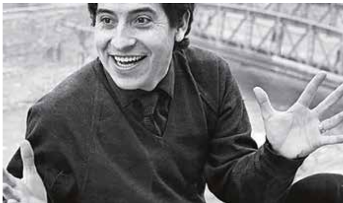
Victor Jara. – Tavshedens mur