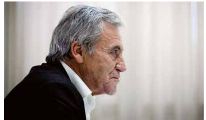
PCPs generalsekretær Jerónimo de Sousa

påtrængende behov for det, der er de væsentlige faktorer i en patriotisk venstrefløjspolitik: at genforhandle gælden; at genvinde offentlig kontrol med strategisk vigtige sektorer og virksomheder, især i finanssektoren; at fremme og øge den nationale produktion, fulgt op af forbedret løn og indkomst til arbejderne og folket og respekt for deres rettigheder: at værne om statens offentlige serviceydelser og samfundsmæssige opgaver; at anlægge en finanspolitik, der letter skattebyrden på arbejdere og små og mellemstore virksomheder, men som sætter skatten kraftigt op på store virksomheders indkomster og på profit, dividende og finansspekulation; og at nægte at underkaste sig Finanspagtens og Den Europæiske Unions pålæg.