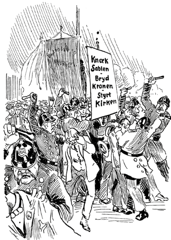
Tegning i "Fremad", maj 1917, skildrer politioverfaldet på S.U.F.s majdemonstration.