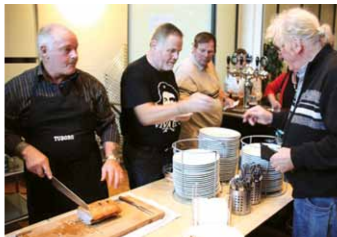
– og så stod den på flæskesteg med det hele