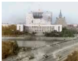
Moskvas kommunister besætter det hvide hus og nægter at forlade bygningen. Jeltsin-tro kampvogne starter et bombardement af det hvide hus, hvor tusinder omkom i ruinerne. Alle lig blev fjernet og kørt til et ukendt sted, hele området blev afspærret, og genopbygningen blev fortaget af tyrkiske 'gæstarbejdere'.