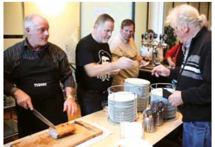
– og så stod den på flæskesteg med det hele