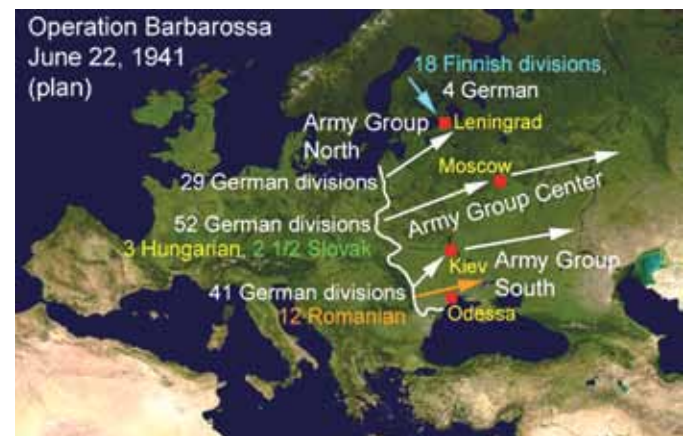
22. juni 1941 startedes den største, og i verdenshistorisk målestok, helt afgørende aggression: "Operation Barbarossa", hvor den nazistiske krigsmaskine med bred støtte fra de vestlige borgerlige diktaturer og demokratier invaderede Sovjetunionen.

De vestlige magters forsøg på at nedkæmpe det nye socialistiske Sovjetunionen startede umiddelbart efter, med at Vestmagterne intervererede militært mod den nyskabte sovjetstat. Selvom disse tidlige forsøg mislykkedes, syntes de under forskellige former at være pågået lige siden. Gennem hele perioden har man opretholdt en omfattende blokade. I hvilken udstræk-