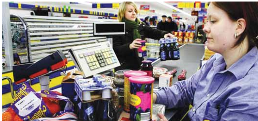
Unge studerende arbejder typisk med service og handel.

Det hele handler ikke bare om at få erfaring fra arbejdsmarkedet, men i høj grad om de unges økonomi. Elendige muligheder for simpelthen at kunne eksistere, få mad på bordet og betale de urimeligt dyre boliger til de unge. De arbejdsløse forældre har ikke mulighed for at finansiere gildet. De unge må finde sig et arbejde og slutte det hele af med en kæmpe gæld, som de er mange år om at afbetale.