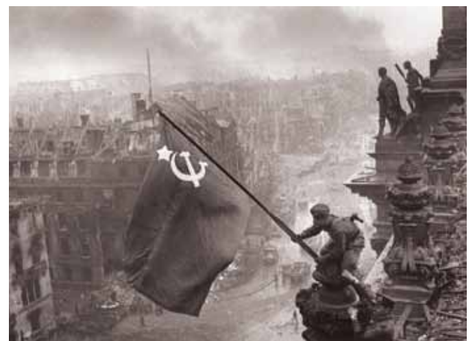
Barbarossas endelige forlis – den røde sejrsvane rejser over Berlin.

ning denne blokade er blevet koordineret med infiltration og sabotage er ukendt, men givetvis ikke af ringe dimensi-