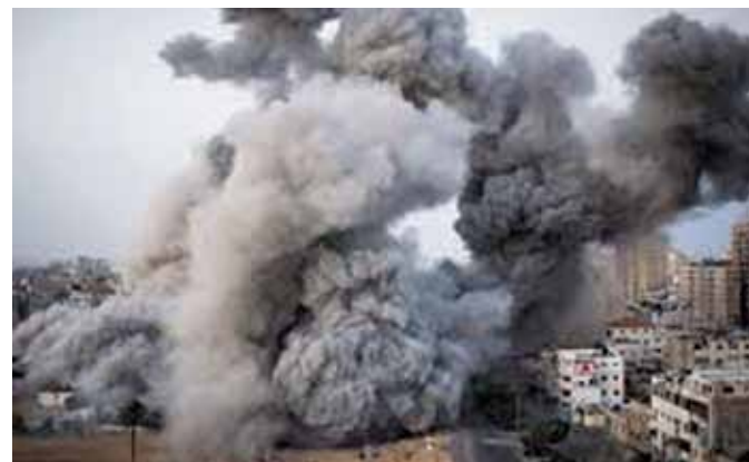
Et af mange israelske bombeangreb mod Gaza.

internationale samfund, ikke gør noget, må befolkningerne udvise solidaritet og kræve stop for Israels forbrydelser.