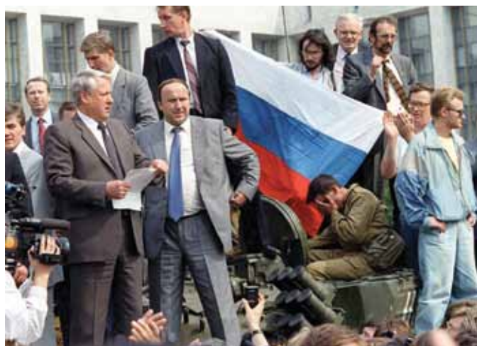
Jeltsin bestiger en kampvogn med loyale tropper foran det hvide hus og sender – mod forfatningen – alle delegerede hjem.