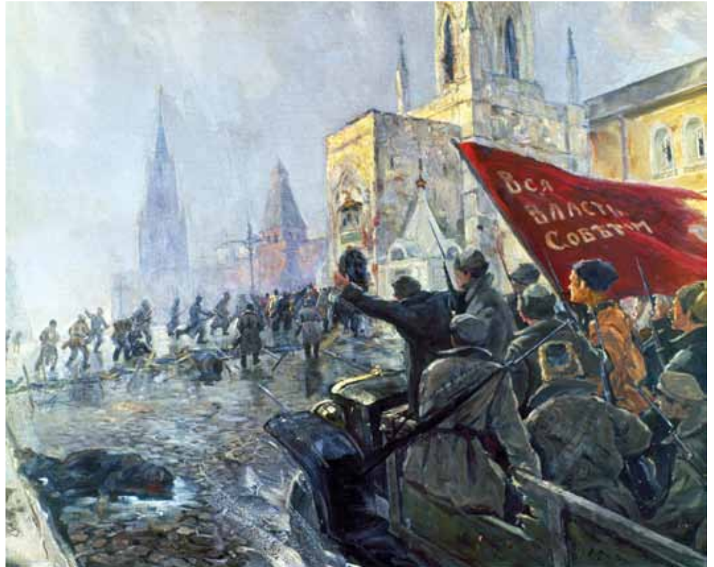
Oktoberrevolutionen i 1917 satte det socialistiske verdenssystem på dagsordenen.

Førend vi begiver os ud på op-søgning af Sandheden et par indledende bemærkninger.