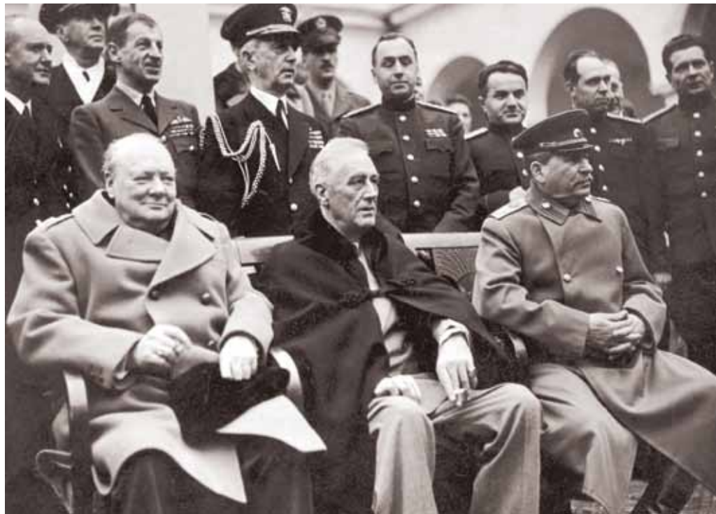
Winston Churchill, Theodor Roosevelt og Josef Stalin trækker nye grænser ved Jaltakonferencen.