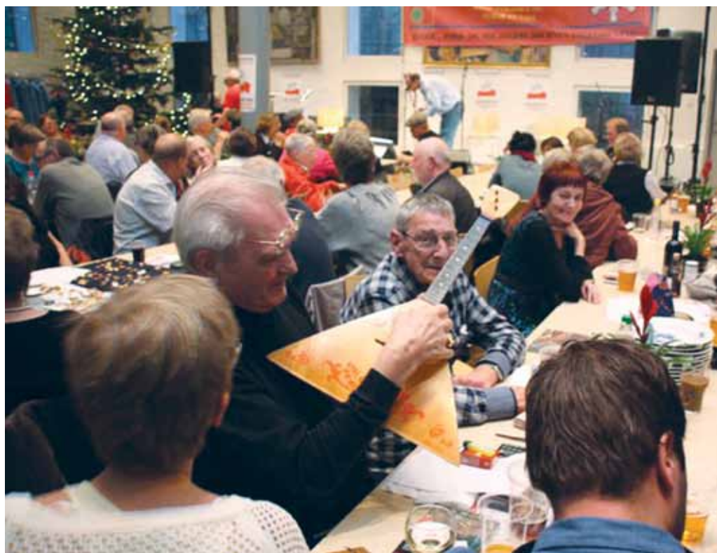
Fra kunst og kongeligt porcelæn til en ægte balalajka på auktionen

Kommunistisk Parti i Danmark og bladet KOMMUNIST udtrykker en dybfølt tak til