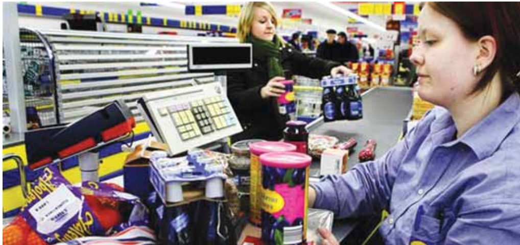
Unge studerende arbejder typisk med service og handel.

Det hele handler ikke bare om at få erfaring fra arbejdsmarkedet, men i høj grad om de unges økonomi. Elendige muligheder for simpelthen at kunne eksistere, få mad på bordet og betale de urimeligt dyre boliger til de unge. De arbejdsløse forældre har ikke mulighed for at finansiere gildet. De unge må finde sig et arbejde og slutte det hele af med en kæmpe gæld, som de er mange år om at afbetale.