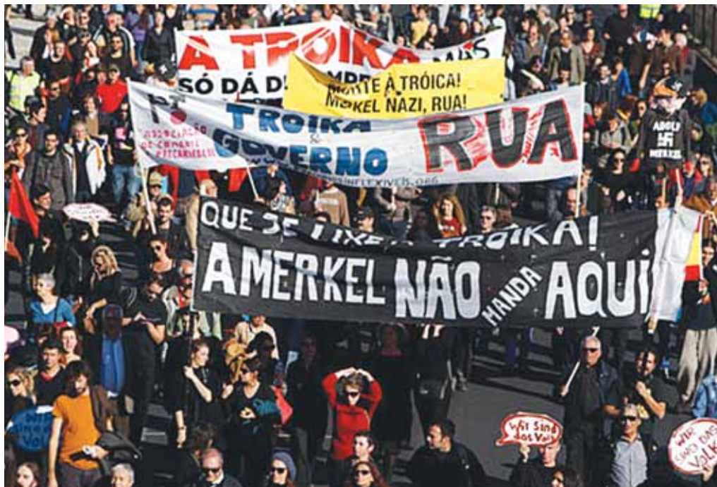
Demonstrationer i Portugal mod EUs krisepolitik i forbindelse med den tyske forbundskansler Angela Merkels besøg. Dagen efter gennemførte faglige organisationer i 23 lande i Europa for første gang en samordnet manifestation.

Danmark var en sørgelig undtagelse på kampdagen. Her nøjedes LO med at sende en solidarisk hilsen til de kolleger der kæmpede i Europa den dag. De der kæmpede