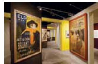
Kobberstiksamlingen på Statens Museum for Kunst ejer ca. 2/3 af disse litografier,

Lautrec var en produktiv kunstner, der især udførte mange litografiske arbejder.