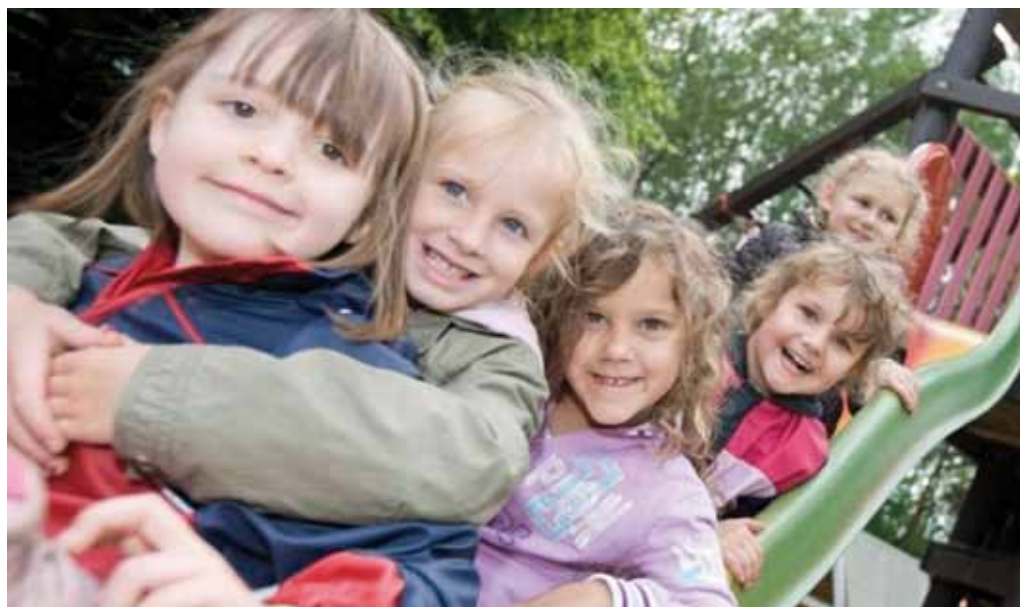
Der er ikke altid plads til én til (arkivfoto)

– Alene de seneste to år er der nedlagt 4.000 fuldtidsstillinger i daginstitutioner, og det er langt mere, end det fallende børnetal kan forklare. Samtidig forventer fire ud af ti kommuner flere besparelser på børneområdet i 2012. Det siger landets børnechefer i en undersøgelse om kommunernes budgetter, som Epinion har lavet for FOA, fortæller Jakob Sølvhøj.