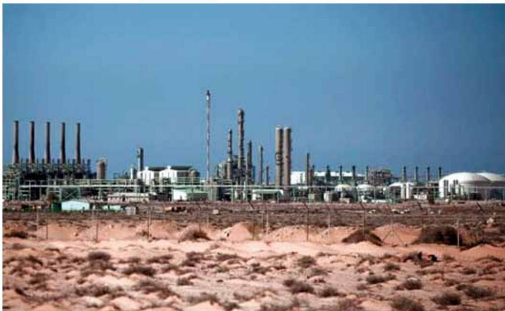
Oliefelternes tilstand er langt bedre end forventet. De fleste af dem er mere end 90 procent i orden.